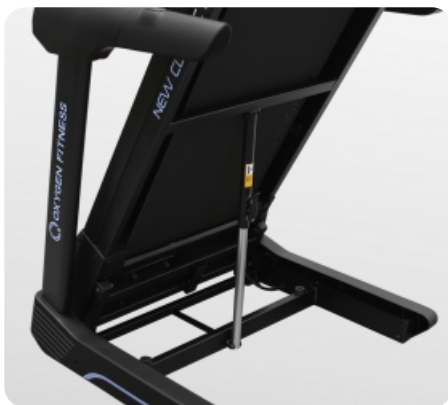
Легкое складывание за счет двухфазной гидравлики easyFOLD™