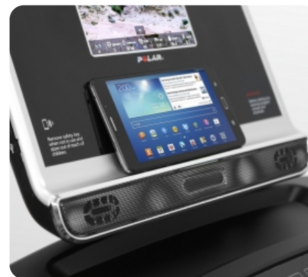
Подставка для гаджетов