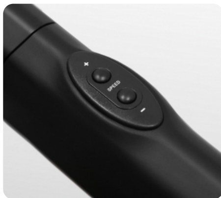
Дополнительные кнопки переключения наклона и скорости