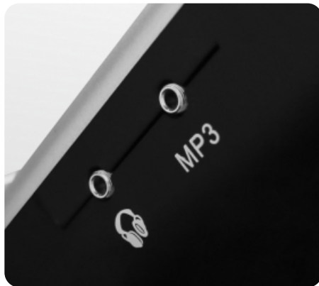
Воспроизведение аудио при помощи AUX IN, AUX OUT и USB