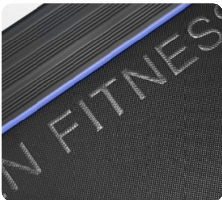
Многослойное полотно Habasit NVT-220 (толщина 2.0 мм)