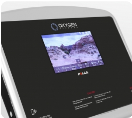
10-ти дюймовый сенсорный цветной TFT дисплей