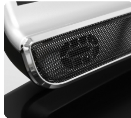
Встроенные динамики мощностью 5 Ватт