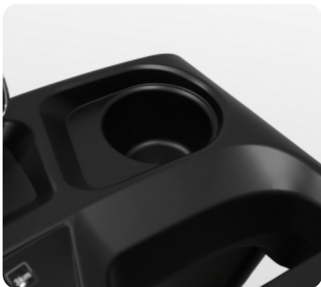
Подставка под бутылочку с водой