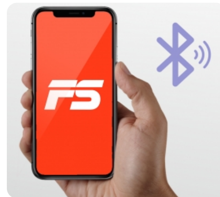
Синхронизация оборудования с мобильным приложением FitShow