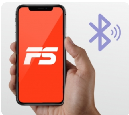
Синхронизация оборудования с мобильным приложением FitShow