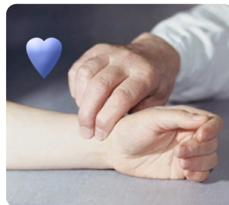
3 пульсозависимые программы