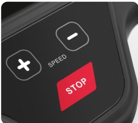
Дополнительные сенсорные кнопки переключения наклона и скорости