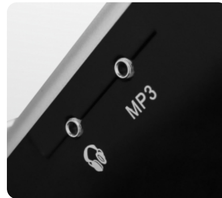
Воспроизведение аудио при помощи AUX и USB