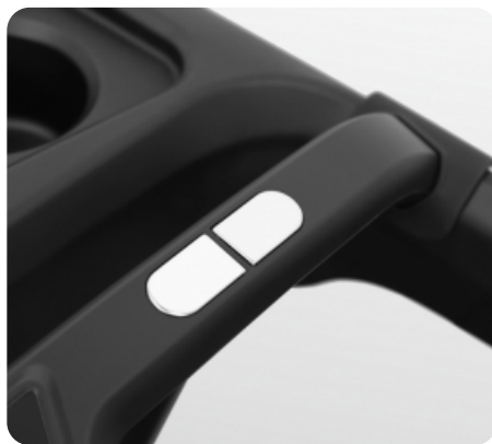
Сенсорные датчики пульса