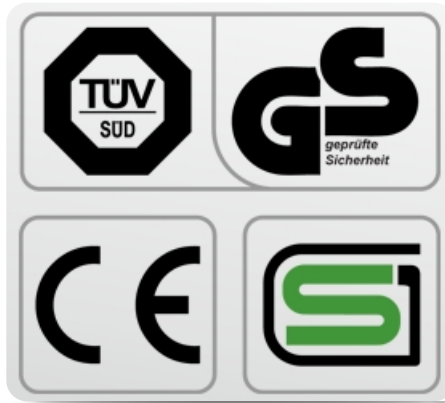
Обязательные сертификаты: европейский CE, немецкий GS TÜV, японский SG