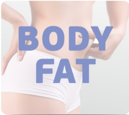
Режим жиранализатора Body Fat для определения комплекции организма