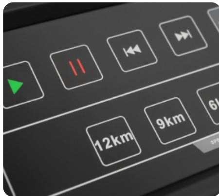
Сенсорные кнопки управления