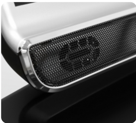
Встроенные динамики мощностью 5 Ватт