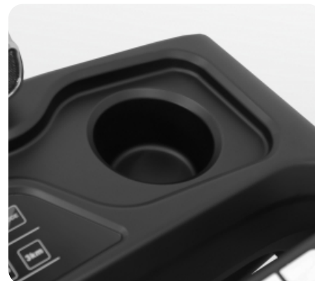
Подставка под бутылочку с водой